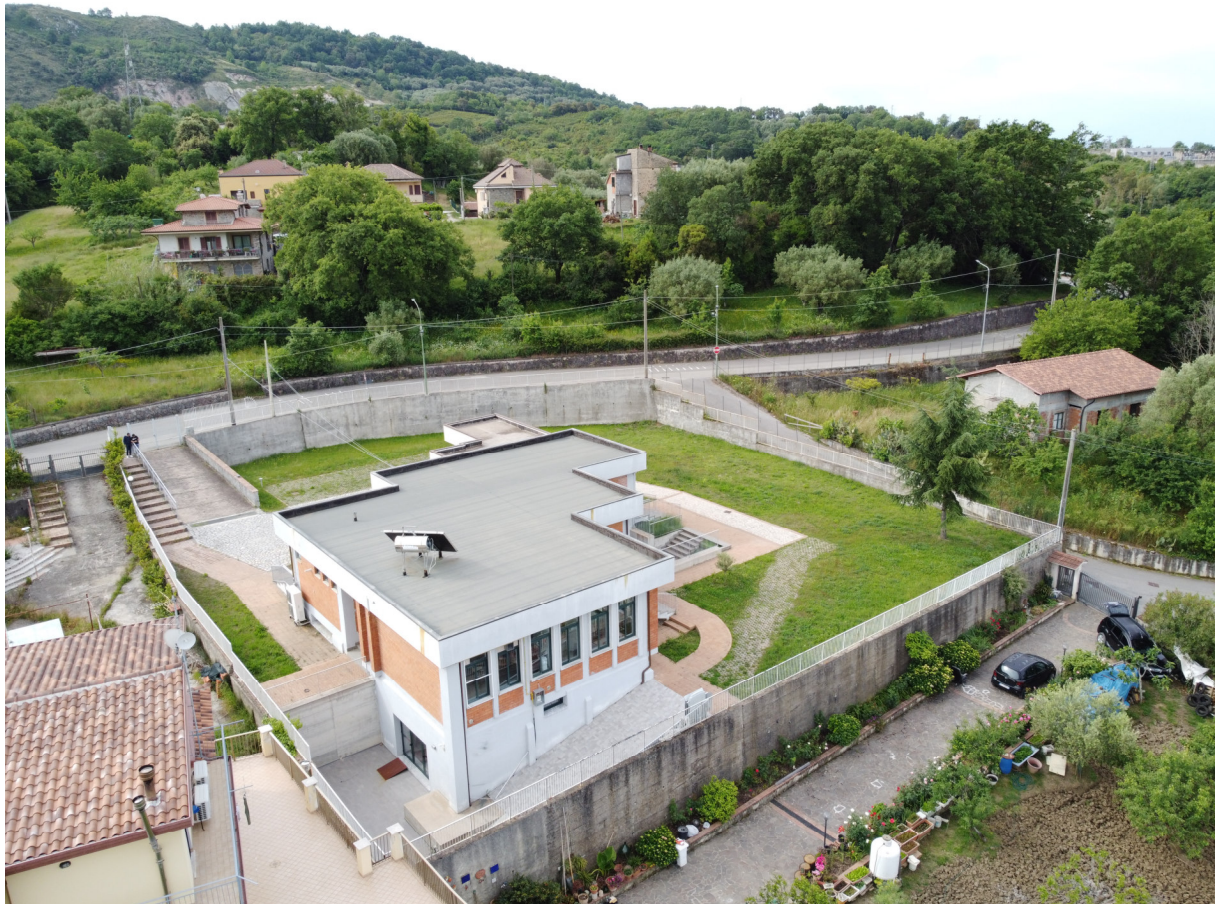
ripresa 3 _visuale aerea lato nord est