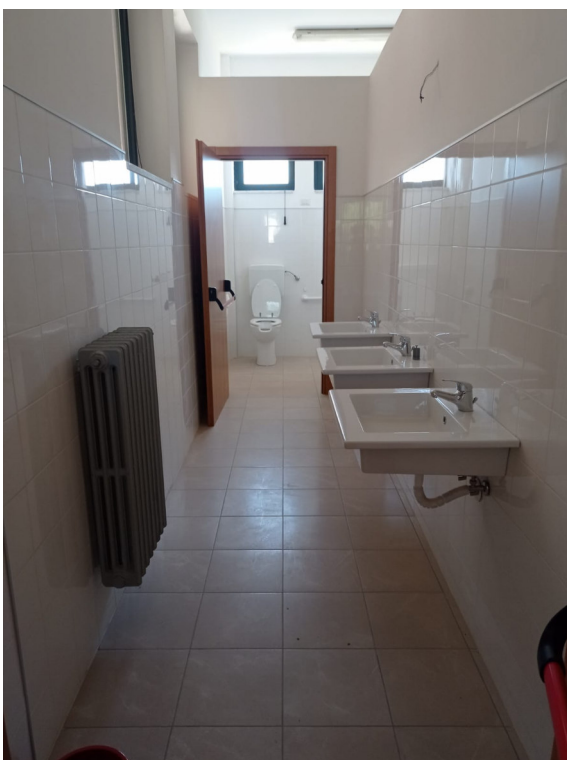
ripresa interna f _servizi