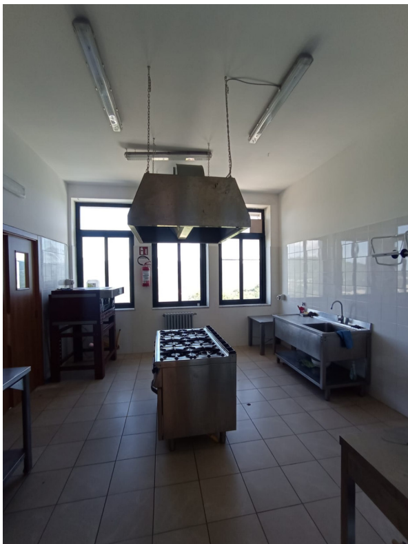
ripresa interna C _cucina