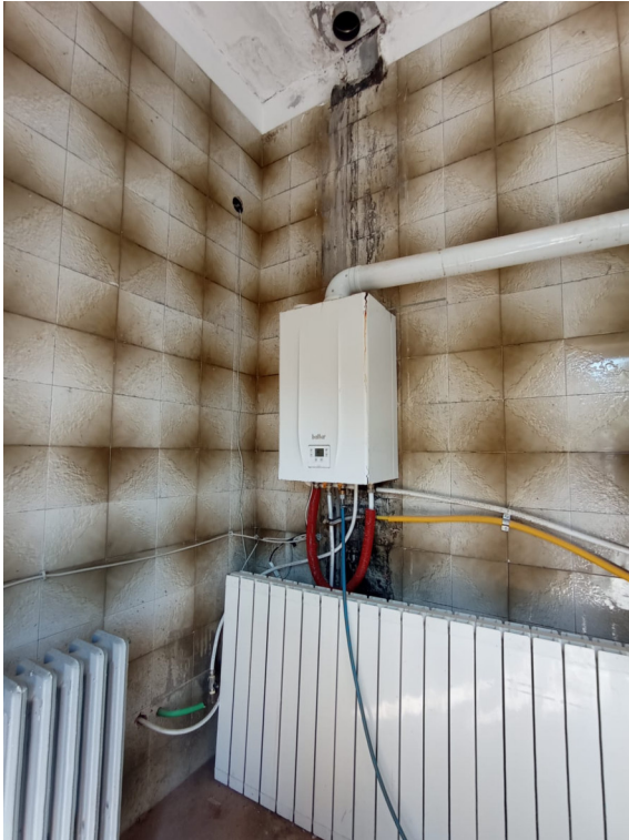
ripresa interna a _locale tecnico/caldaia