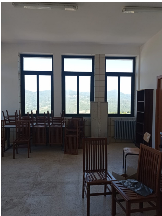
ripresa interna e _refettorio