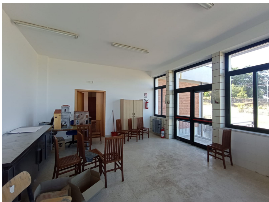
ripresa interna d _refettorio