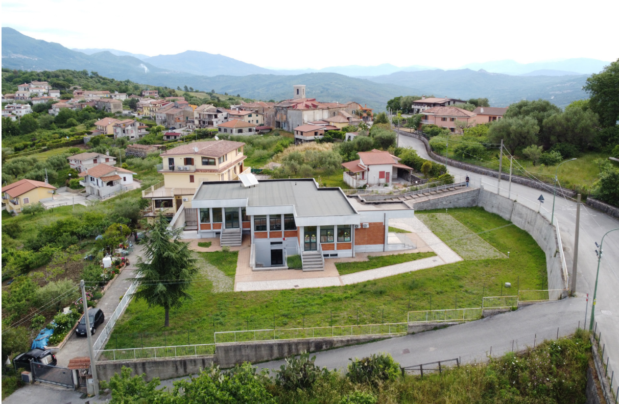
ripresa 5 _visuale area lato ovest