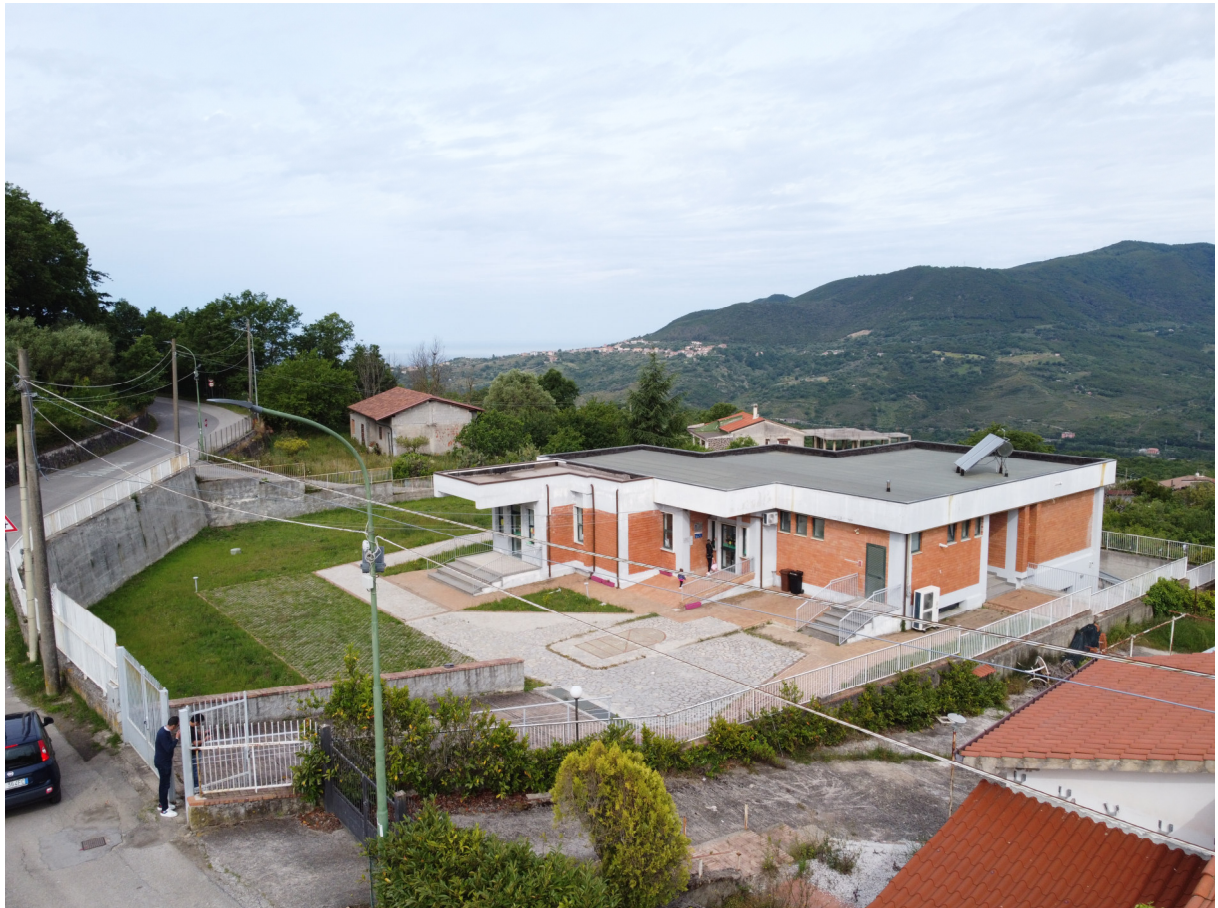
ripresa 1 _visuale aerea lato sud est