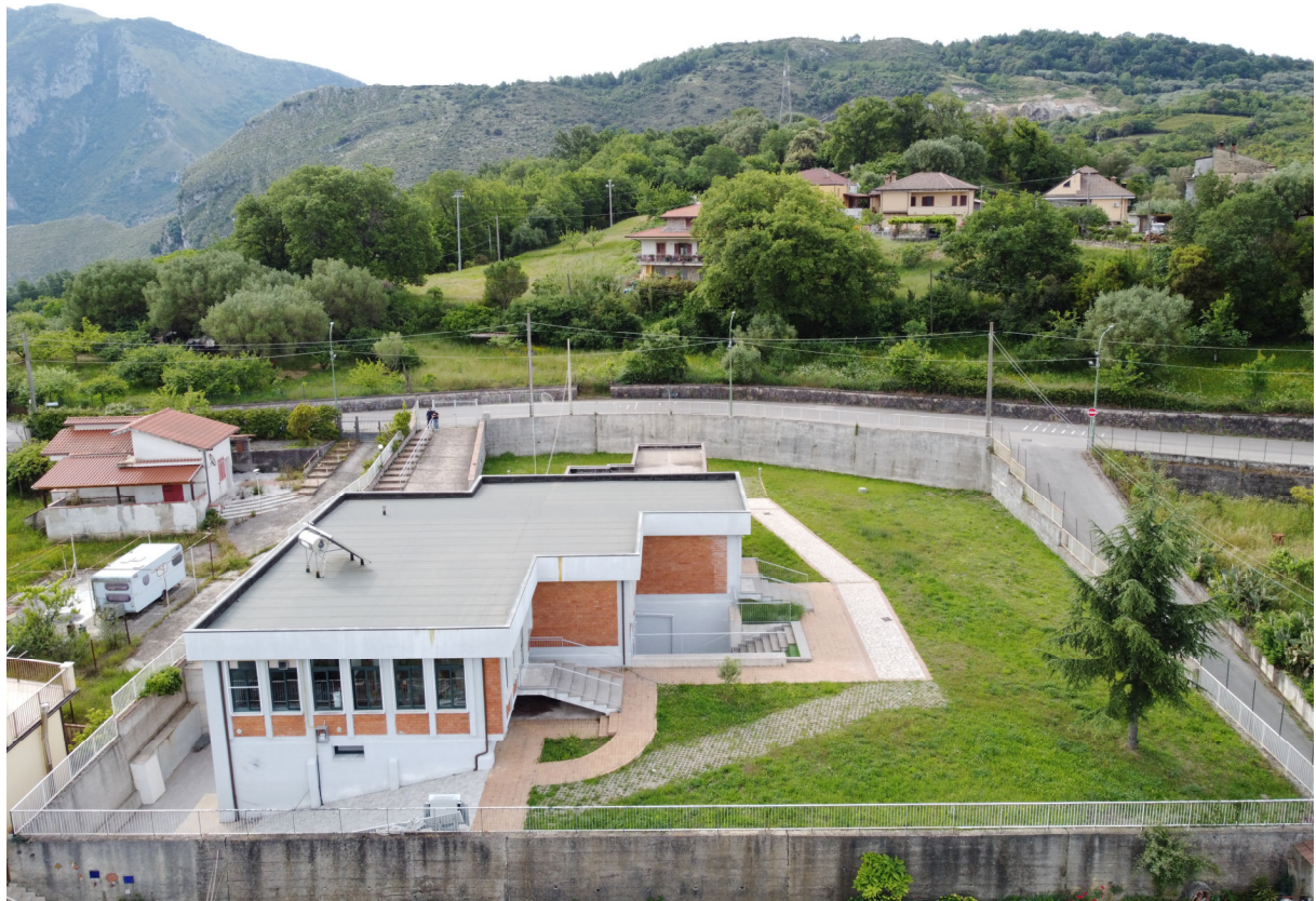
ripresa 4 _visuale area lato nord