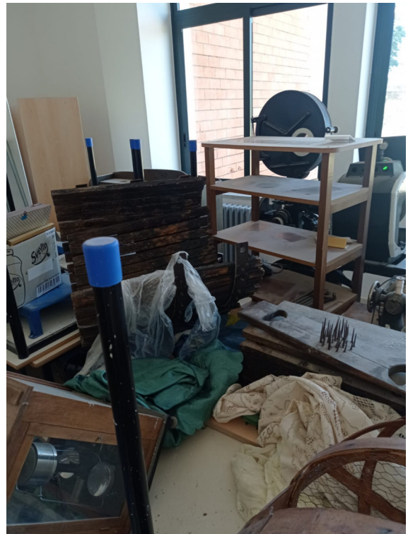
ripresa interna b _interno aule