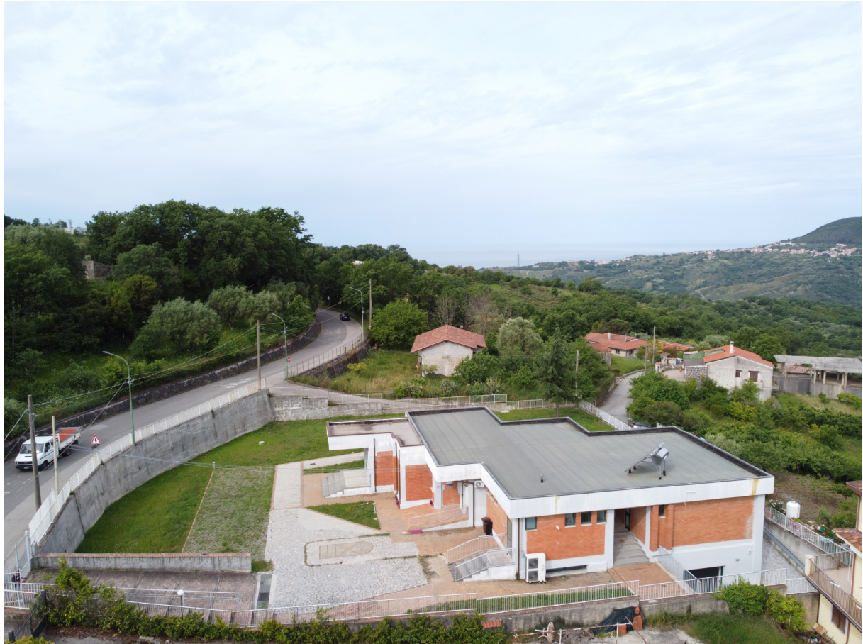
ripresa 2 _visuale aerea lato est